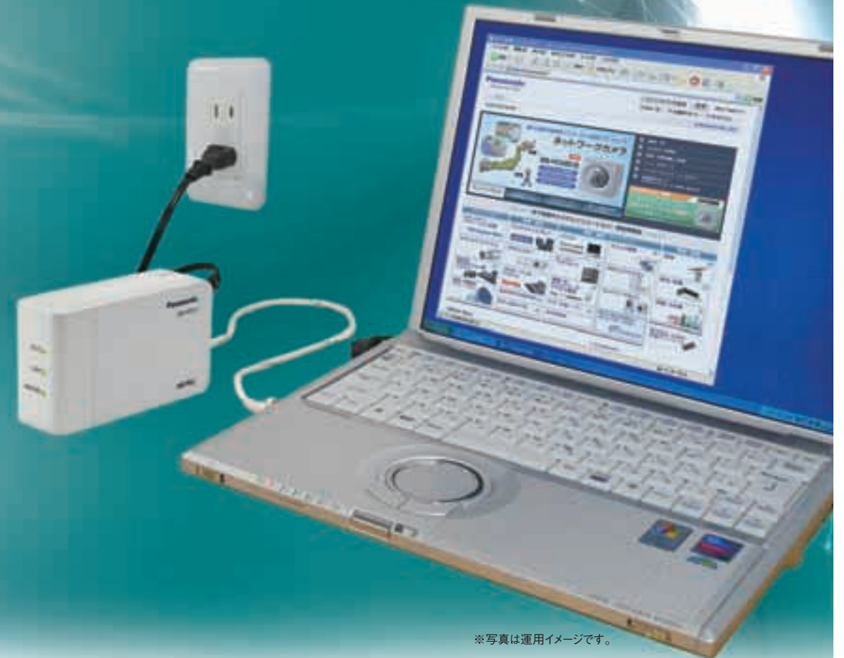
※写真は運用イメージです。